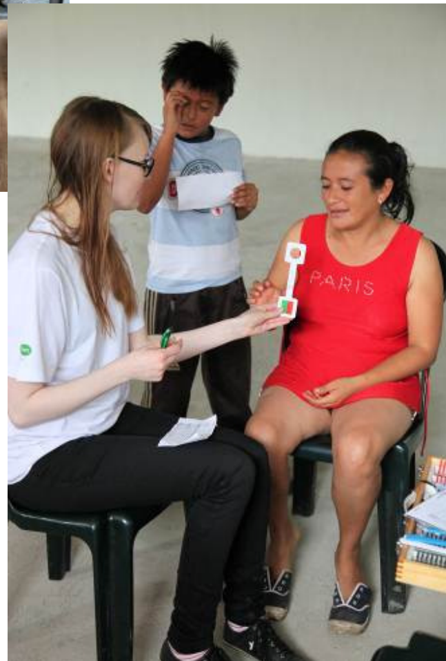
Emma, lapsi ja äiti