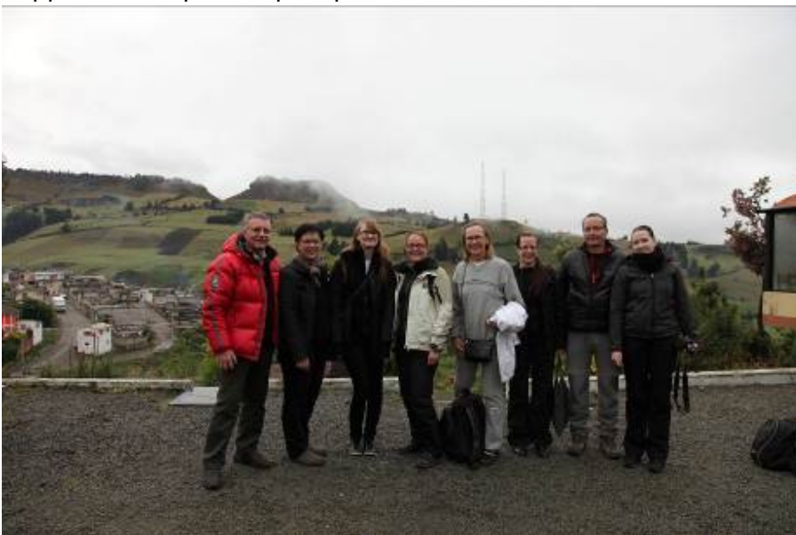
Ryhmämme valmiina tositoimiin aamulla klo 7.00

Yö Quitossa pienessä Andimon hotellissa sujui hyvin. Kaikille maistui uni. Puolen päivän jälkeen maanantaina tuli pakettitoyota ja kuljettaja. Matkalaukkujen määrä ja koko tuottivat päänsärkyä. Siirtelyn ja sovittelun jälkeen kaikki oli matkassa. Tiukkaa teki. Mahtavat maisemat ja kurjat ajotiet tekivät vaikutuksen. Illansuussa olimme perillä. Tästä El Refugiosta tuli kotimme melkein kahdeksi viikoksi. Korkeutta oli yli 3 000 m; parhaimmillaan jopa yli 4 000m. Se tuntui. Pää olikin sitten kipeänä kolme päivää. Yöt olivat kehoja, kun keuhkoista meinasi ilma loppua. Hotellimme – kylän ainoa – oli jääkylmä. Yöllä lämpötila laski nollian paikkeille. Lämpöpatteri ennätti olla päällä vain yöntunnit sillä päivisin henkilökunta kävi nappaamassa patterit pois päältä. Illalla takaisin tullessa oli taas kylmä.