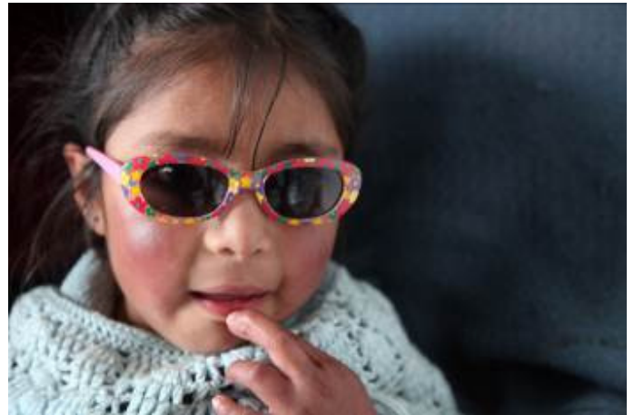
Chizo Juanissa sisaruksilla aurinkolasit