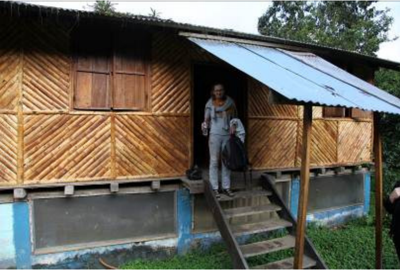
Bambumajassa vietimme yhden yön

Chizo Juan oli useamman tunnin ajomatkan päässä. Jäimme siis Chizo Juaniin yöksi. Olimme lähes viidakossa. Lämmintä, kosteaa ja kuraista. Saatoimme luopua lämpökalsareista. Ruhtinaallista. Nukuimme bambumajassa – ihan oikeassa. Siinä oli yksi iso huone keskellä ja kaksi pienempää huonetta laidoilla. Yö meni kohtalaisesti, yksi otti sieltä mukaansa kirpun. Kirpun kanssa tuli nukuttua muutama yö. Aamulla laskimme, kuinka monta uutta punaista pistettä oli ilmestynyt ympäri keskivartaloa. No se villainen aluspuku joutui suljetuksi muovikassiin ja kirppu tuli Suomen pakkasiin. Taisi jäätää.