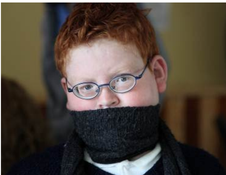
Koulupoika näki luokkatoverit ensimmäistä kertaa näiden lasien ansiosta

Chillanessa tutkittaviksi tuotiin koululaisia. Pienille miinusvoimakkuuksille oli kysyntää, mutta meillä oli enimmäkseen pluslinssijä mukana. Yksi superlöytö osui tähän kylään. 10-vuotias punapää poika osoittautui -14 dpt myoopiksi. Ei laseja. Vaan meilläpä oli mukana muutama pari vahvoja miikkoja. Poika sai kaksi paria itselleen. Näki ensimmäistä kertaa lähes tarkasti pidemmälle kuin 7 cm päähän! Vau! Tarkastimme hänen poliisi serkkunsa ja serkun vaimon. Kaikki saivat lasit + aurinkolasit. Ja tunnin kuluttua tarkastuksista me saimme valtavan pussillisen muffinsseja – kiitokseksi. Muffinssit tekivät hyvin kaupansa paluumatkalla.